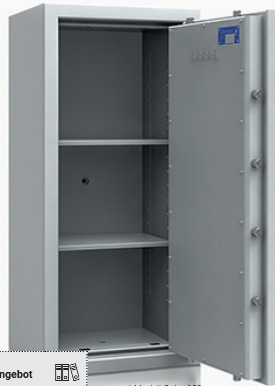
* Modell Cuba 120

Mechanisches Kombinationsschloss 3390 (Aufpreis – Art. P80120)