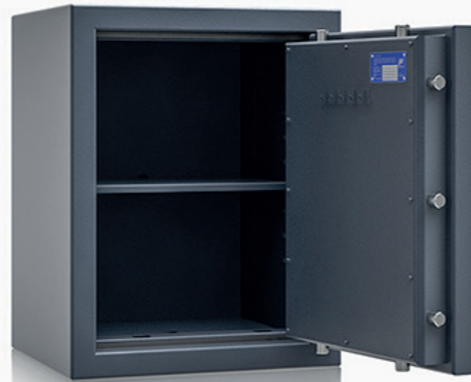
* Modell Gini 700

Mechanisches Kombinationsschloss 3390 (Aufpreis – Art. P80120)