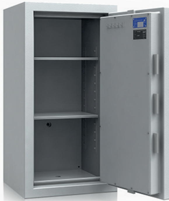
* Modell Liberty 1000

Elektronischschloss B90 (Aufpreis – Art. P80190)